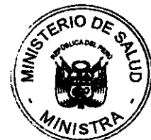
PATRICIA J. GARCÍA FUNEGRA Ministra de Salud